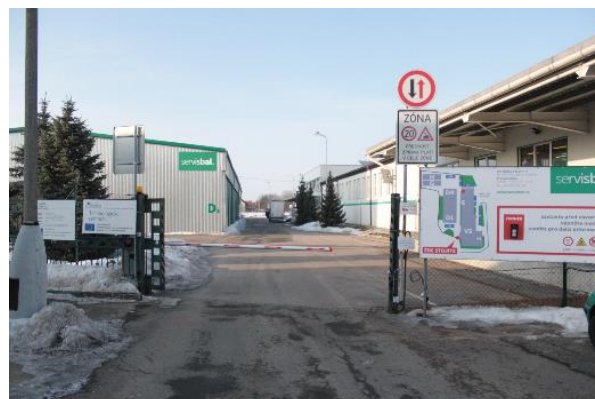
Příjezd do areálu

Prosím dodržujte pokyny na informační tabuli a řiďte se dopravním značením!