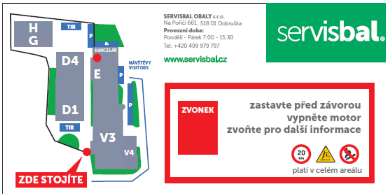
Informační tabule před vjezdem